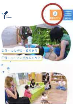
地域子育て支援拠点利用 お母さんや子どもと一緒に保護者が抱っこ、文楽トランプゲームの体験、子育て相談、子育て情報提供などを行います。